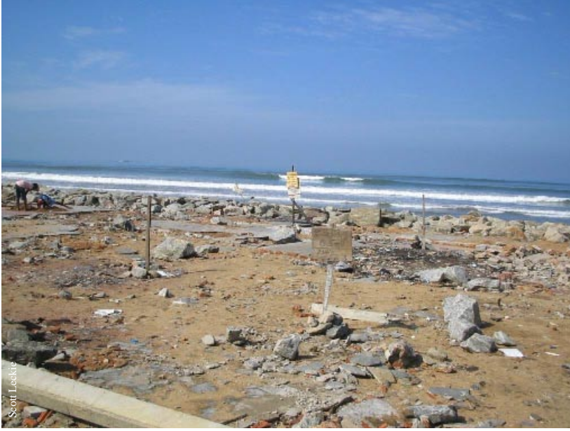
இலங்கையில், வீடுகள் நிமிர்ந்து நின்ற இடங்கள்

குஜராத் மானில் அரசு செயற்பட்ட விதத்தை அரசுகளும் வெளிநாட்டு நிறுவனங்களும் மாதிரியாகக் கொள்ள வேண்டும். உள்ளூர் சமூகங்களையும் உள்ளூர் நிறுவனங்களையும் மீள்கட்டுமானப் படிமுறையை முன்னெடுக்க அனுமதித்ததையும், மானில் அரசோ அல்லது தனியார் துறையோ மீள்வீடமைப்பு முயற்சியை பொறுப்பேற்றிருந்தால் நடந்திருக்கக்கூடிய வேகத்தைக் காட்டிலும் மேற்குறித்தவர்களின் முயற்சியால் எவ்வளவு விரைவாக மீள்வீட்டுக்குத் திரும்ப முடியுமோ அவ்வளவு விரைவாக பாதிப்புற்றோர் திருப்பியதைப் கவனத்தில் கொள்ளல் வேண்டும்.